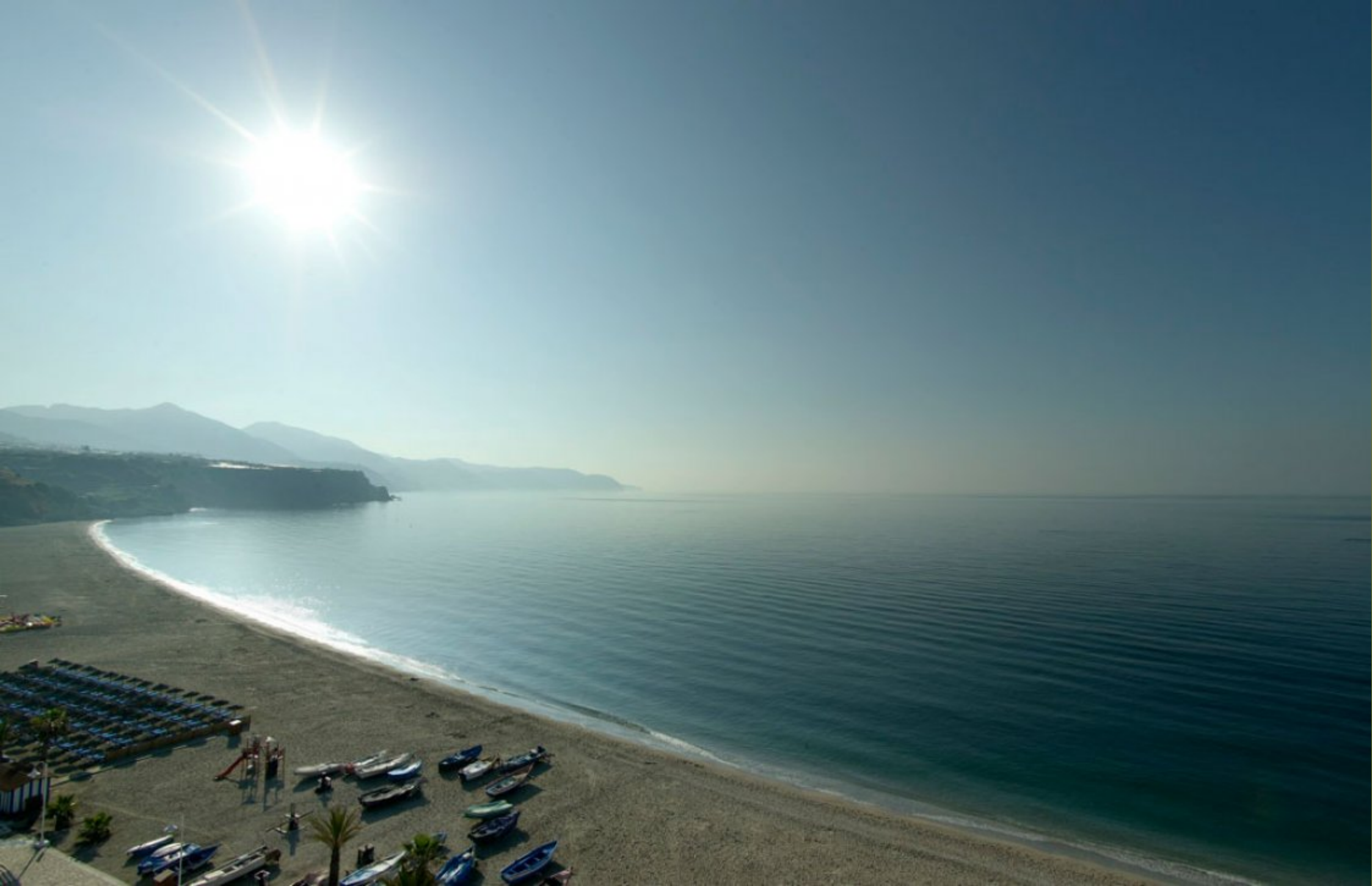
Parador de Nerja Entorno