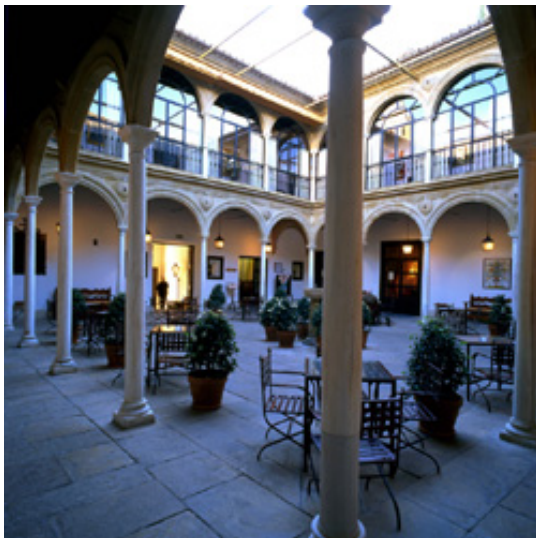
Parador de Úbeda (Jaén) Ruta Nazarí

À ces produits s'ajoutent les promotions habituelles de Paradores , comme la 'Carte Cinq Nuits', 'Jours Dorés' (avec des remises pour les plus de 60 ans) ou 'L'Escapade Jeune' (pour les moins de 30 ans).