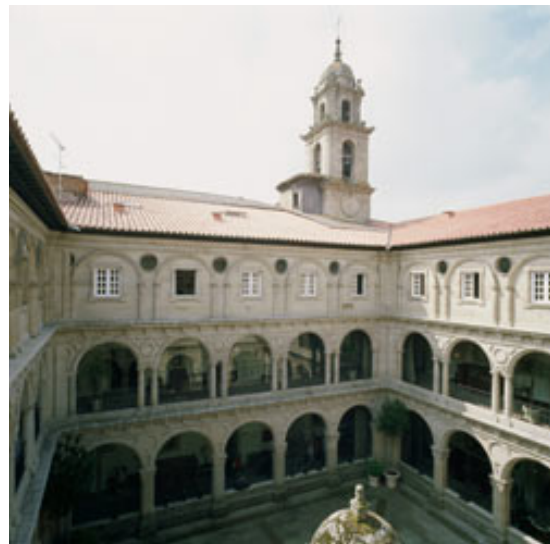
Parador de Monforte de Lemos (Lugo) Ruta Camino de Santiago

Ceux qui s'intéressent au golf ont aussi diverses possibilités de pratiquer ce sport dans les Paradors. Le Réseau a deux terrains privés, dont l'un, El Saler, est parmi les 60 meilleurs au monde. Nous offrons également 50 autres terrains répartis dans toute l'Espagne, avec lesquels des accords ont été passés pour que nos clients puissent gérer toute leur activité sportive directement avec nous.