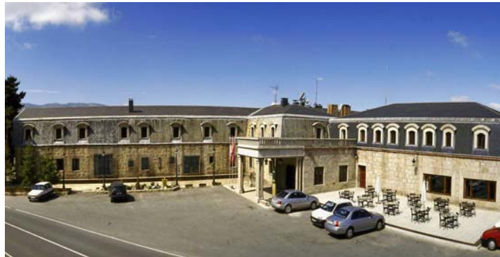
Parador de Gredos, 2006

Tous les ans, des centaines de milliers de touristes entreprennent des parcours à travers l'Espagne en suivant le sillage des Paradors. À partir de nos établissements, il est possible de suivre des circuits tels que celui de Don Quichotte, celui du Chemin de Saint-Jacques ou celui des villages blancs d'Andalousie, parmi bien d'autres. Il existe également des Paradors dans les Villes Patrimoine de l'Humanité, comme Tolède, Ségovie, Avila, Saint-Jacques de Compostelle, Salamanque... et dans les parcs naturels les plus importants du pays.