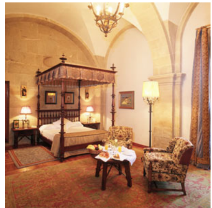
Parador de Santiago

Un autre nouveau produit est constitué par ce qu'on appelle les 'Expériences', dont l'objectif est de convertir la chambre du client en une expérience unique, en ajoutant au logement un programme de loisirs actif tout nouveau, émotionnel et qui laisse son empreinte chez le client. Nos clients peuvent devenir des empereurs de la Mérida Augusta et vivre comme de nobles romains, en s'alimentant comme eux et en découvrant, dans une optique très particulière, les amphithéâtres, les ponts et autres monuments qu'ils bâtirent il y a deux mille ans. Ils peuvent aussi devenir des moines et découvrir, comme Fray Guillermo de Baskerville, dans 'Au