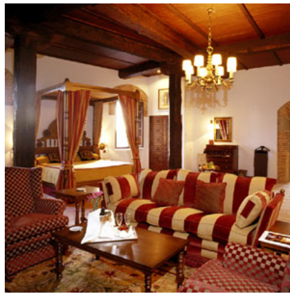
Parador de Plasencia