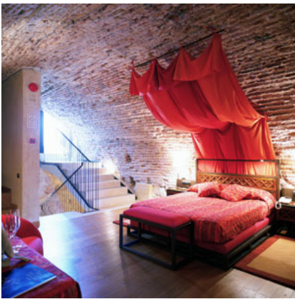
Parador de Alarcón

Ce produit contraste avec un autre, très particulier et luxueux, dénommé 'Chambres Uniques'. Des plus de 5.600 chambres que possède le Réseau, on a sélectionné les 60 les plus spectaculaires, les véritables pièces dans lesquelles se sont reposés des rois et des nobles, au plus haut de la tour d'un château médiéval ou dans la cellule de l'abbé d'un monastère cistercien. Bien sûr, elles présentent toutes de nombreux détails ajoutés, comme des dîners dégustation, des décorations très spéciales et, surtout, la sensation de savourer un petit morceau de l'histoire ancienne de l'Espagne.